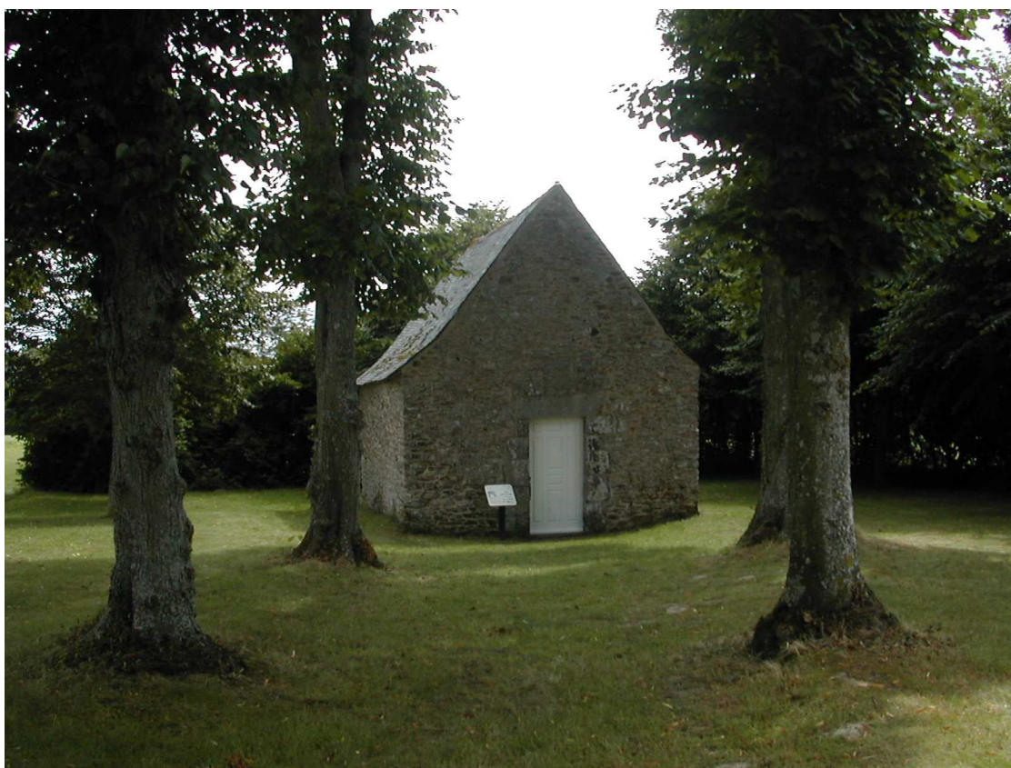
La Chapelle des Vaux