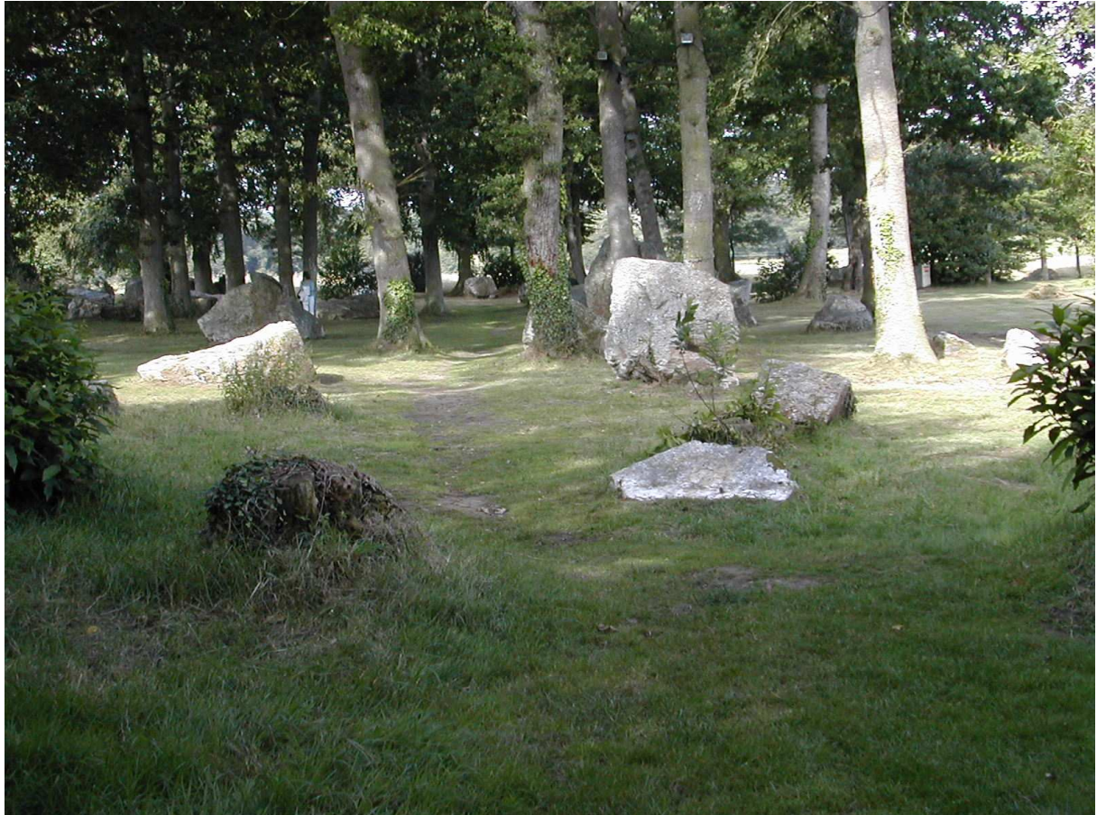
Le champ des Roches ou cimetière des Druides

Ce circuit d'une distance de 13,5 Km est balisé jaune, c'est une balade dans la campagne. Le départ se situe sur le parking près de l'église de Pleslin. On se dirige ensuite vers les champs des Roches. La durée du circuit est d'environ 3h. 30. On peut prendre un parcours plus court en s'arrêtant après être revenu sur l'église de Pleslin.